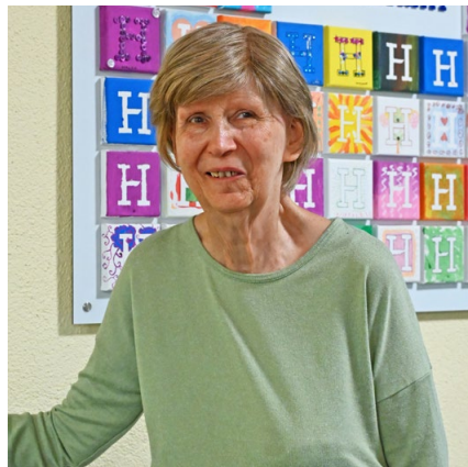
Rosmarie del Ponte